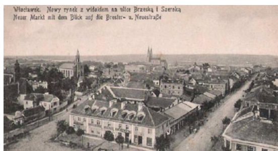
Panorama Włocławka z lat I wojny światowej (1914-1918)