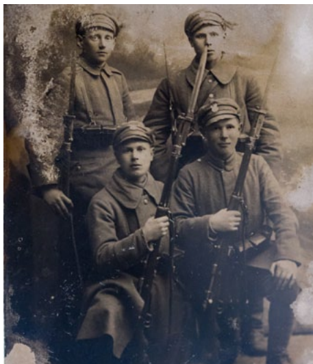
Fotografia czterech żołnierzy 31. Pułku Piechoty z 1919 r.