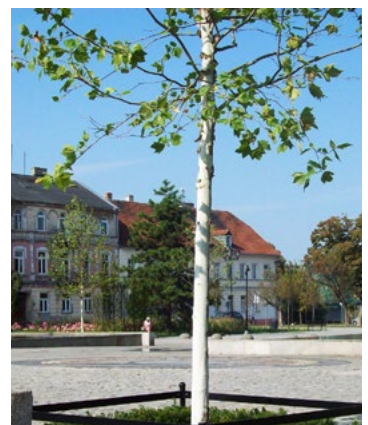
Ostatnie promienie letniego słońca. Migawki z Placu Wolności i Starego Rynku